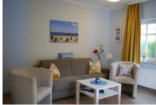
Blick von der Küchenzeile in den Wohnraum.