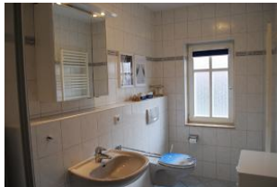
Blick in das Bad.