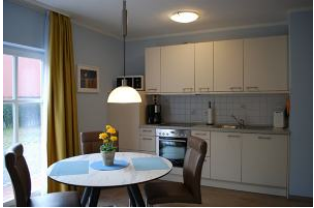
Der Essbereich mit kompletter Küchenzeile.