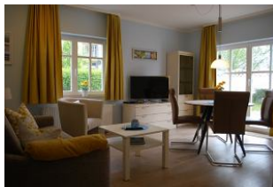
Blick in den Wohnraum. Das Sofa ist ausziehbar und sorgt für gemütlichen Schlaf.