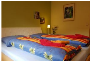
2. Blick in den Schlafraum.