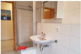
2. Blick in das Bad.