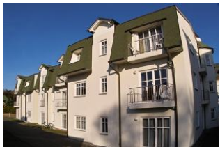
Rückansicht des Hauses.

Das Feriendomizil Goethestr. ist strandnah gelegen und nur wenige Gehminuten von der Promenade und dem Ahlbecker Ortskern entfernt. Die 45 m 2 große Erdgeschoss-Ferienwohnung 06 ist gehoben ausgestattet und verfügt über einen großzügigen Wohnbereich mit Schlafcouch, offener voll ausgestatteter Küchenzeile und Essplatz, einen Schlafraum (Doppelbett) und ein Duschbad. Es stehen kostenfreies Wlan und ein PKW-Stellplatz zur Verfügung. Haustiere sind leider nicht gestattet. Wir sind Partner von UsedomRad. Leihen Sie sich bei uns im Büro ein Fahrrad aus und erkunden Sie unabhängig und flexibel die traumhafte und vielfältige Sonnensinsel Usedom. Als Kurkarteninhaber können Sie zudem die Busse der Usedomer Bäderbahn (UBB) kostenfrei nutzen.