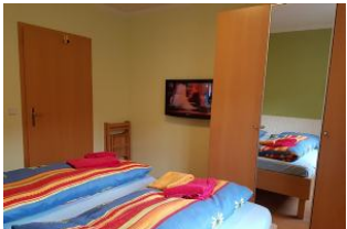
Blick auf das Entertainment im Schlafraum.